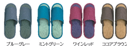
ブルーグレー ミントグリーン ワインレッド ココアブラウン