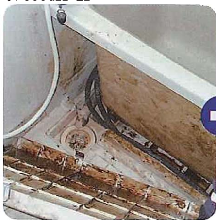
カビが生えやすい浴槽のエプロンの内側も…