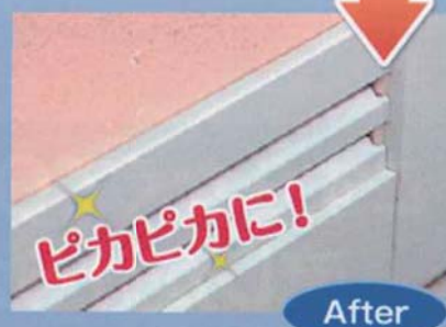
●落ちにくいゴムパッキンの汚れ