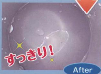
●パイプのドロドロ汚れ