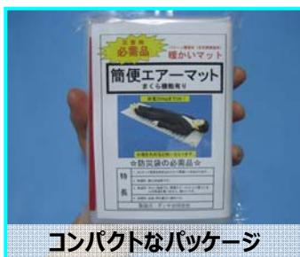
コンパクトなパッケージ

空気層のマットはクッション性も高く、適度に柔らかい為、寝心地もよいのが特徴です。