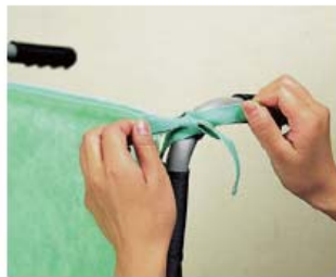
車いすの押し手レバーにひもを 結ぶだけの簡単セット