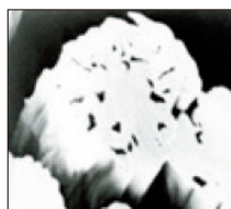
繊維断面拡大写真

繊維1本1本の表面に、多数の溝があり繊維の表面積を広げ、水分の吸収・拡散・放出する高機能繊維を使用しております。